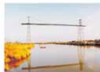
ROCHEFORT New York - France Cable Foster & Partners / Foster, 1993