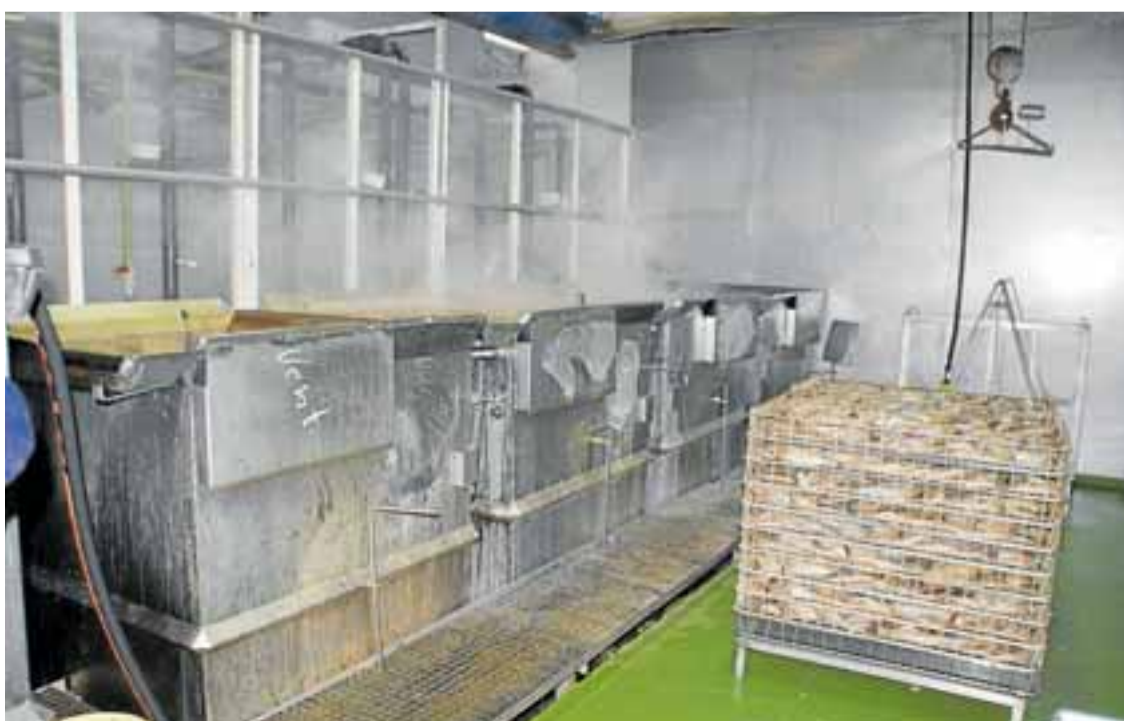
Proceso de cocción de bonito en salmuera.