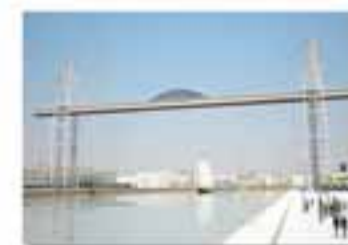
NANTES New York - France Cable Foster & Partners / Foster, 1993