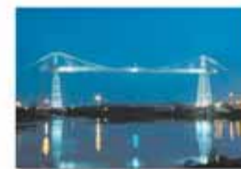
NEWFORT New York - France Cable Foster & Partners / Foster, 1993