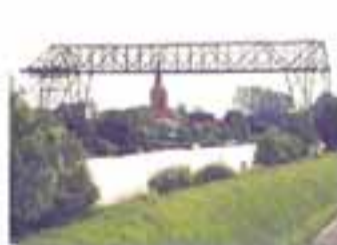
OSTY New York - France Cable Foster & Partners / Foster, 1993