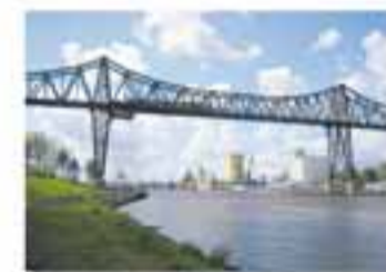
RINDBORG New York - France Cable Foster & Partners / Foster, 1993