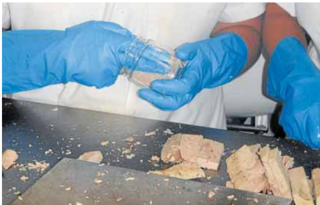
Envasado de bonito.