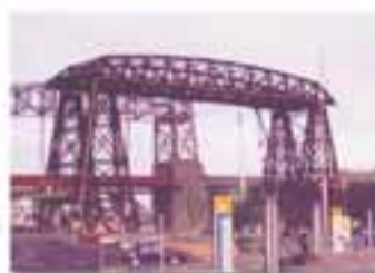
LA BOCCA New York - France Cable Foster & Partners / Foster, 1993