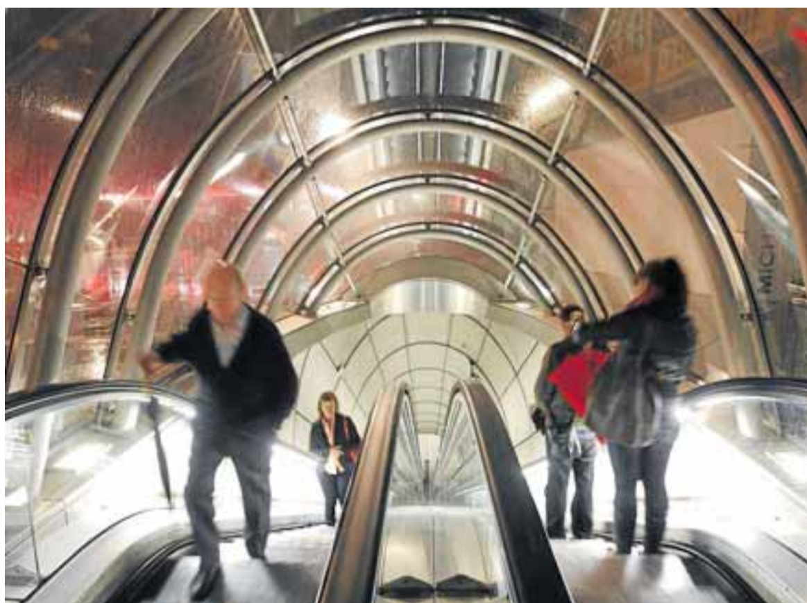
Una imagen de Metro Bilbao, consolidado 25 años después.