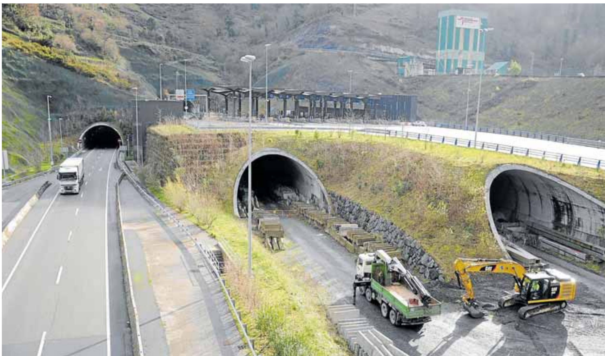
Vista de las obras de la Variante Sur Metropolitana que dará ritmo y fluidez a Bizkaia.

La Variante Sur Metropolitana y el túnel que unirá las dos márgenes de la Ría bajo las aguas conforman las obras más importantes acometidas en Bizkaia en lo que va vivido del siglo XXI en el territorio