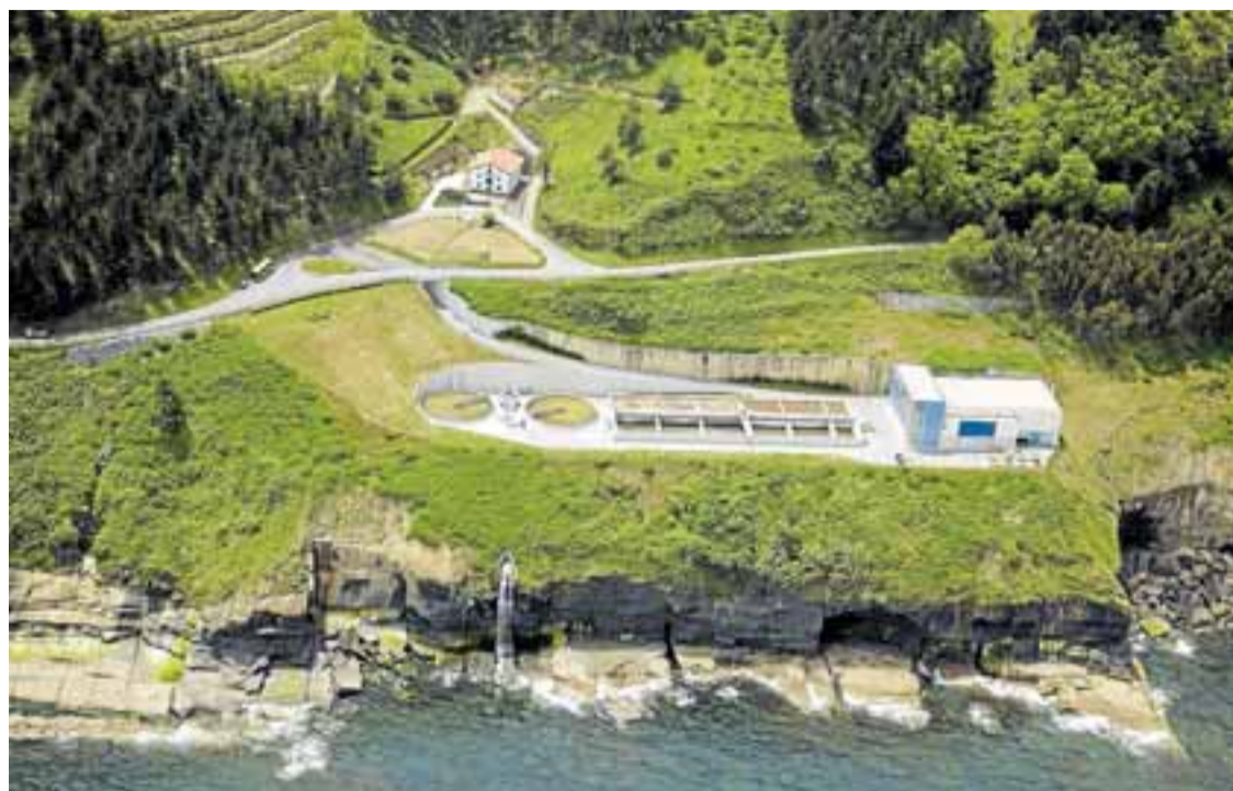
Estación Depuradora de Aguas Residuales de Ondarroa.