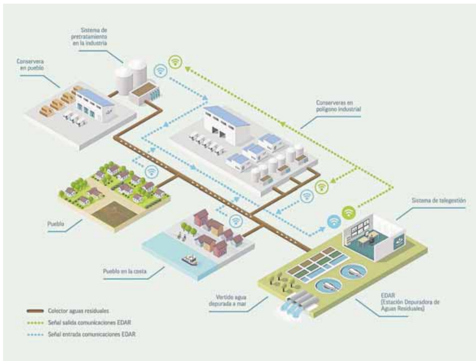
Sistema inteligente de integración de vertidos industriales en la red de colectores urbanos.

“El contexto del proyecto nos ha permitido trabajar más estrechamente a todas las partes implicadas y a llegar a acuerdos consensuados para conseguir la meta principal que es que los efluentes sean devueltos depurados a la naturaleza, permitiendo a su vez, la sostenibilidad a largo plazo tanto de las empresas conserveras como de las entidades gestoras del agua y los habitantes de la zona”