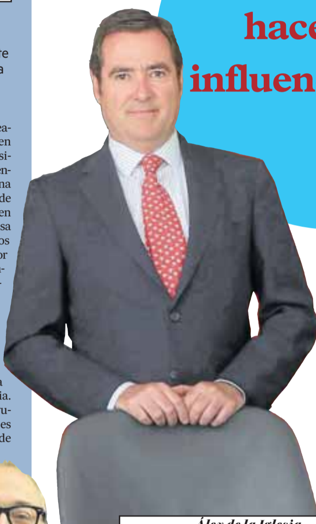
Álex de la Iglesia