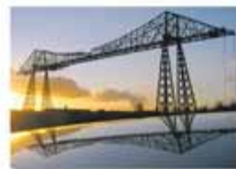
MIDDELBURGH New York - France Cable Foster & Partners / Foster, 1993