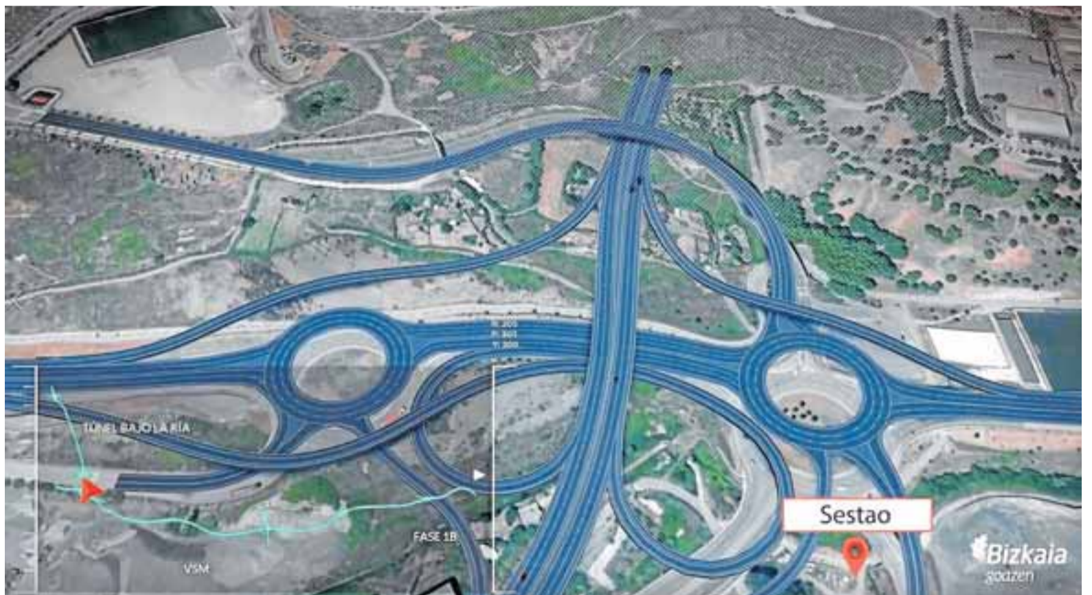
Vista aérea sobre donde se imagina el túnel bajo la ría, un viejo sueño.

les, 4 pasos inferiores, 3 pasos superiores, se han modificado 11 pasos superiores e inferiores existentes y se ha construido una pasera peatonal para conectar los bidegorris de la Margen Izquierda con los de la Zona Minera. Es la obra que no cesa, ya ven.