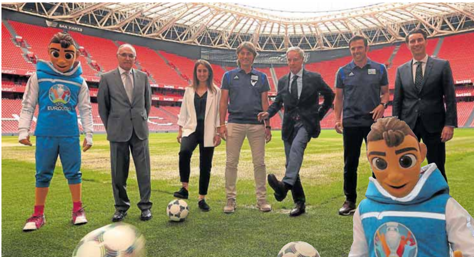
Momento del día de presentación de la Eurocopa 2020 en San Mamés.

La todopoderosa feria de la Máquina-Herramienta y el manga, anime y la cultura japonesa del Japan Weekend Bilbao, la Eurocopa de 2020 en San Mamés y los 25 años de vida de Metro Bilbao... ¡No para el carrusel!