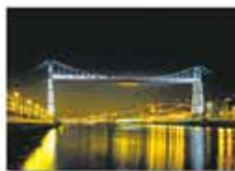
BILBAO New York - Spain Cable Foster & Partners / Foster, 1993