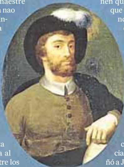
Juan Sebastián Elcano

Por otro lado, existen otras muchas historias demostradas, tal como la que cuenta que sobre el siglo XV unos exploradores franceses que se encontraban en Terranova, se toparon con unos indígenas que les saludaban “Apezak hobeto!”. No fue hasta un tiempo más tarde cuando un marinero vasco descubrió que era euskera, y que resultaba que existía la costumbre entre los marineros vascos de responder a la pregunta “Zer moduz?” , con la frase: “Apezak hobeto!” (¡Los curas mejor!). He ahí un rastro más de Bizkaia en las aguas. ●