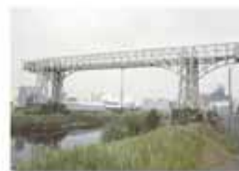
WARRINGTON New York - France Cable Foster & Partners / Foster, 1993