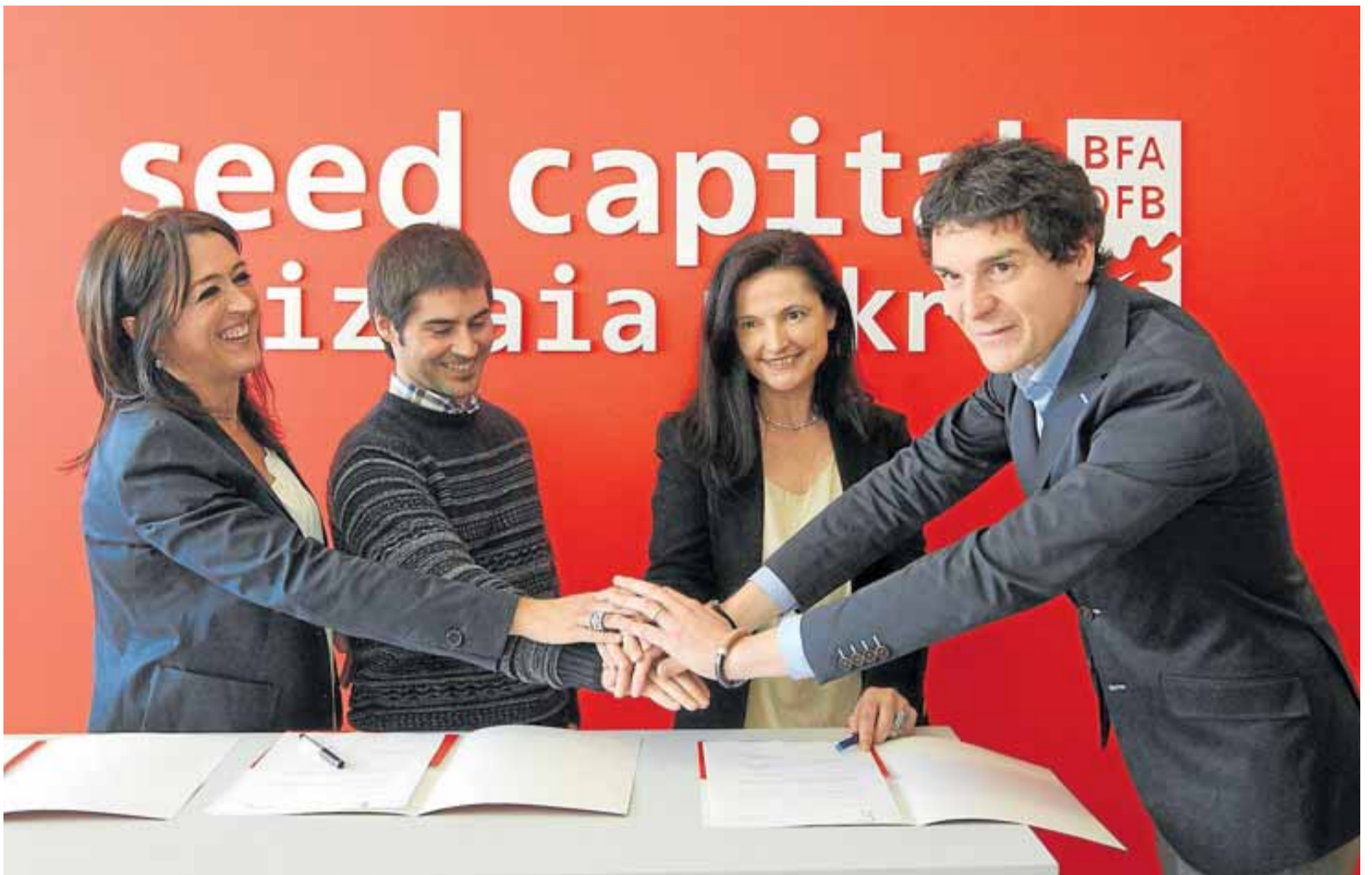
Firma de seed capital Bizkaia, toda una apuesta de progreso.

Un viento nuevo sopla de cola. Provoca que aquel ‘Bizkaia goazen’ ideado para dar impulso a Bizkaia y sacarla de la crisis de paso al ‘Bizkaia egiten’, que recoge el compromiso de trabajar para construir un futuro mejor aprovechando las buenas horas